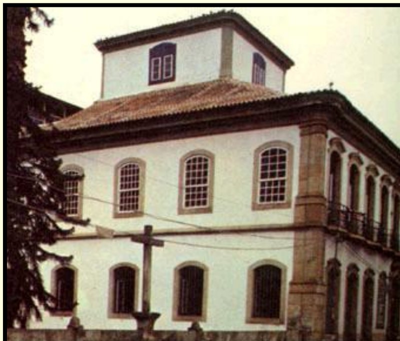
A Casa dos Contos em Ouro Preto, onde funcionava a Casa de Fundição